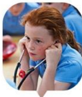
SKRÝVAČI SVÝCH SCHOPNOSTÍ