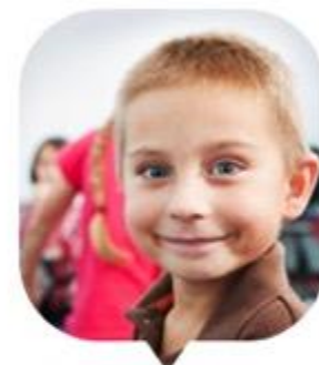
S DVOJÍ VÝJIMEČNOSTÍ