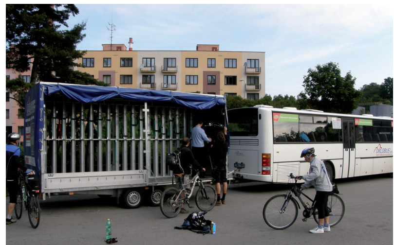
Milovníky kol oblíbené cyklobusy zajiždějí v Kladském pomezí i do sousedního Polska

Ročně najedou cyklobusy v Královéhradeckém kraji přes 140 tisíc kilometrů. Projekty, které pomohly zlepšit cestování turistů s koly, podpořil kraj za poslední tři roky zhruba 26 milionů korun. Na provoz cyklobusů pak přispěl kraj za předchozí dva roky prostřednictvím grantů přes 5 milionů korun. (RUK)