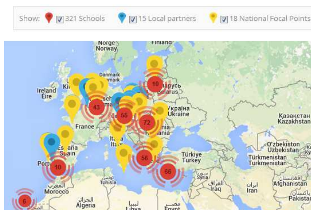
Obr. 2 Účastníci kampaně Traffic Snake Game (zapojené školy, místní partneři a národní kontaktní místa, leden 2015; http://www.trafficsnakegame.eu/participants/ )

Kampaň „Oblékáme hada Edu“ je součástí evropského projektu Traffic Snake Game , do kterého je zapojeno celkem 18 zemí (včetně České republiky a Slovenska). V roce 2014 se kampaně účastnilo více než 300 škol po celé Evropě.