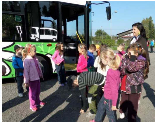
Akce „S hadem Edou na dopravní hřiště!“ v Třinci (18. 9. 2014,)