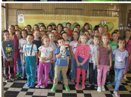
Kampaň „Oblékáme hada Edu“ na školách v roce 2014 Více fotografií na webu kampaně: http://www.trafficsnakegame.eu/pictures/?country=7 (Filtr: Česká republika)