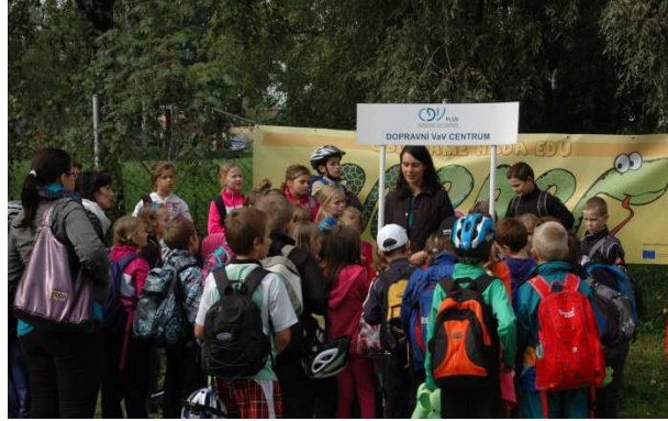
Evropský týden mobility ve Zlíně (16.-17. 9. 2014,)