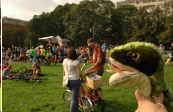
Kampaň s hadem Edou na brněnské cyklojízdě Nakoleon (20. 9. 2014,)