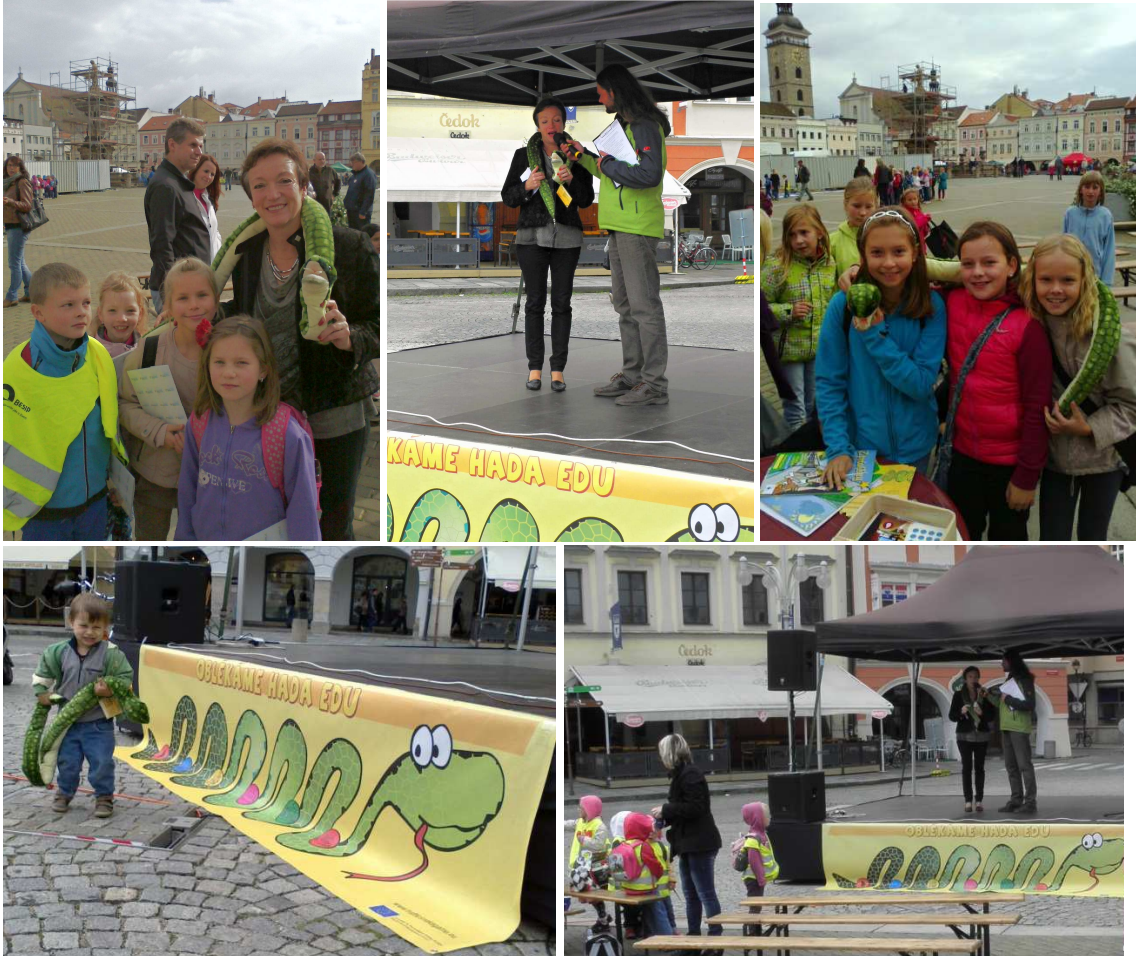
Evropský den bez aut v Českých Budějovicích (22. 9. 2014,)