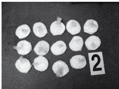
v každém sáčku 1000 ks Extáze