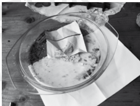
sušící tál s hotovým pervitinem