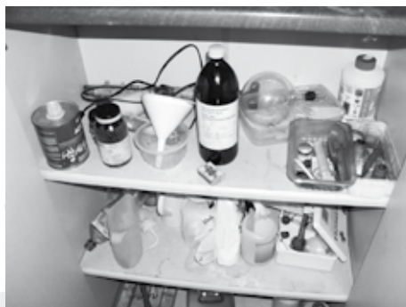
věci a přípravky na výrobu pervitinu