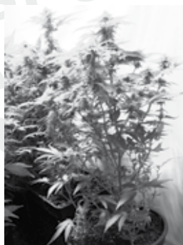
květináč s rostlinou marihuany