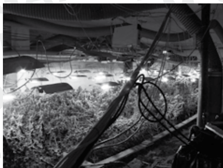
větší vietnamská indoor pěstírna marihuany