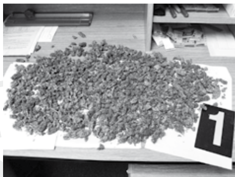
sušené palice marihuany po sklizni a usušení, před nasáčkováním