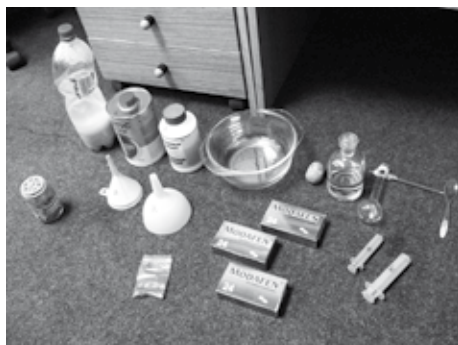
kompletní malá mobilní laboratoř na výrobu pervitinu