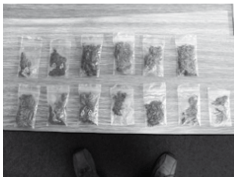
nasáčkované palice (marihuany) před distribucí