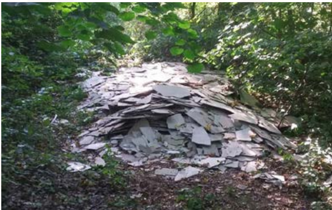
Příloha č. 2

Azbest můžete najít v nejrůznějších stavebních materiálech, od střešních krytin (tzv. eternit) přes potrubí kanalizačních stoupaček, opláštění vzduchotechnických rozvodů až po volně stojící zástěny ke kamnům nebo jako podložky pod starými elektrickými vypínači. Z azbestu mohou být izolační nástřiky na stěnách nebo mezi zdmi a obložením budov.