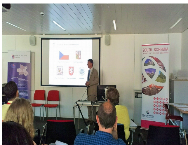
Český velvyslanec v Belgii Jaroslav Kurfürst