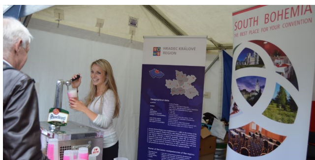
Stánek České republiky