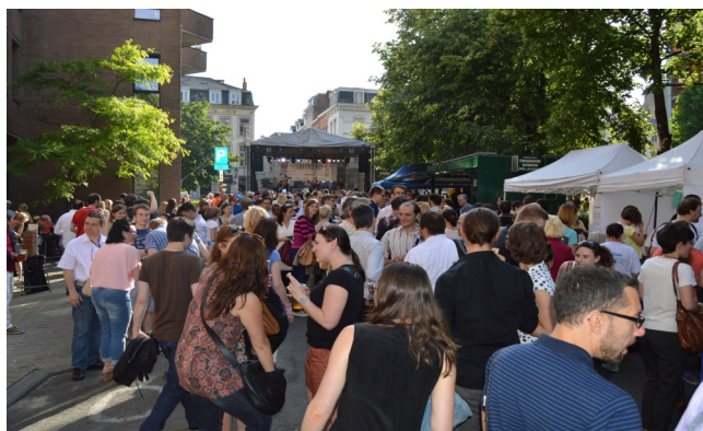
Ulice Rue de Caroly - Czech Street Party