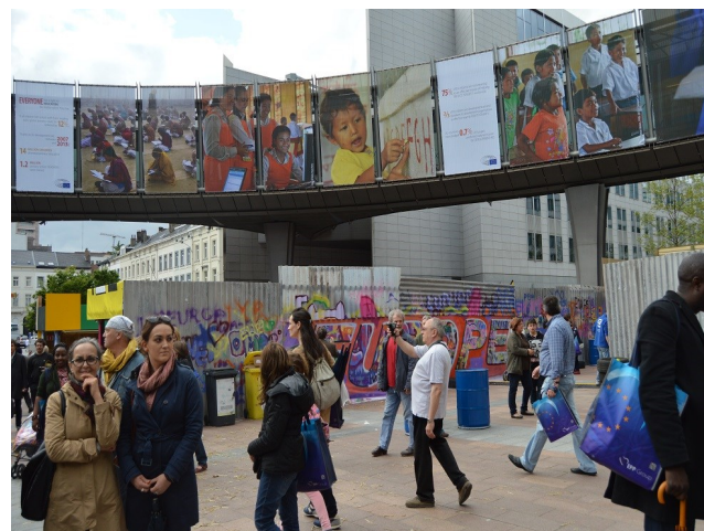
Prostor před budovou Evropského parlamentu