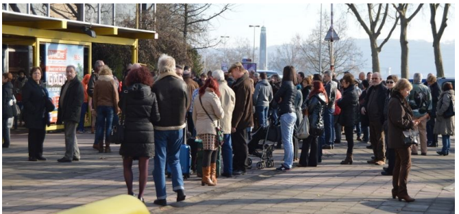
Fronta před otevřením veletrhu