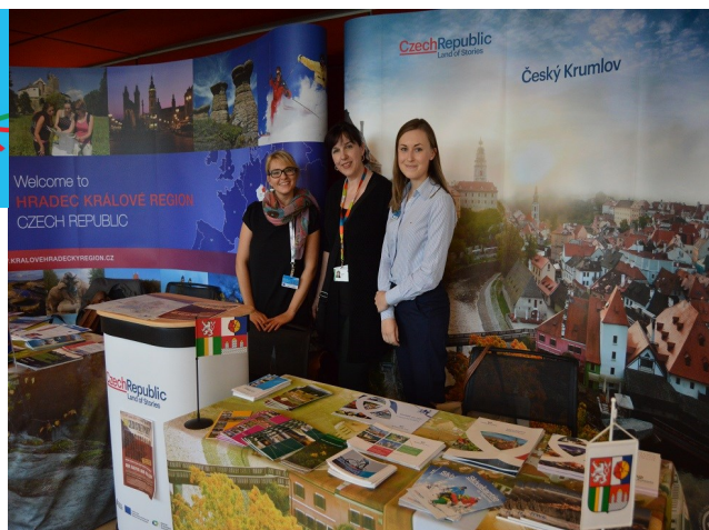
Stánek KHK a JČK před zahájením Open Days

Avšak největším lákadlem pro návštěvníky byla tradičně Evropská rada, kde se střetávají špičky a hlavy států z celé Evropské unie. V Evropské radě nebyly ke zhlédnutí pouze prostory pro jednání COREPERu, ale vše od hlídaného příjezdu do budovy pro nejvyšší představitele států až po kulatý stůl, kde titi představitelé zasedají. Festival Open Doors stejně jako loni navštívilo během jediného dne přes 40 000 návštěvníků.