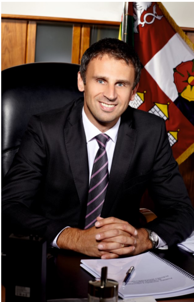
Jiří Zimola, hejtman Jihočeského kraje

Úplné znění Bílé knihy o dopravě a stanovisko Evropského výboru regionů naleznete na stránkách www.krajeveu.cz , sekce Instituce EU, oddíl Evropská komise a oddíl Výbor regionů.