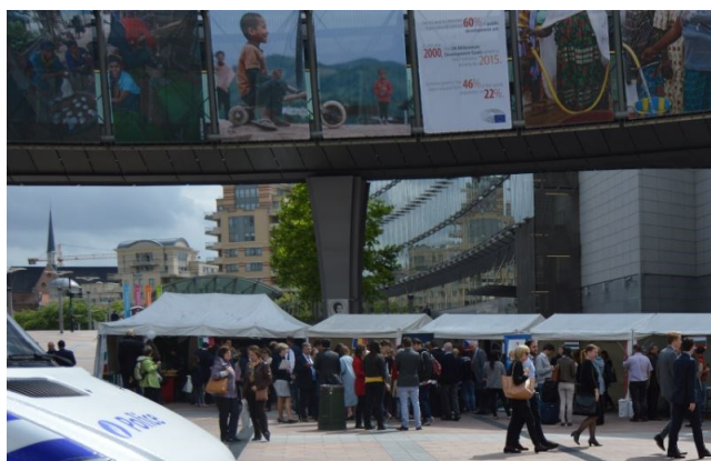
Esplanáda Evropského parlamentu

Pokud si přejete pravidelně dostávat elektronickou verzi Zpravodaje Jihočeského a Královéhradeckého kraje nebo máte připomínky či dotazy k danému zpravodaji, neváhejte nás kontaktovat na: rprihoda@kr-kralovehradecky.cz .