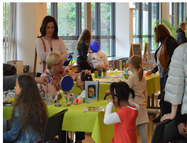
Dětské aktivity ve Výboru regionů