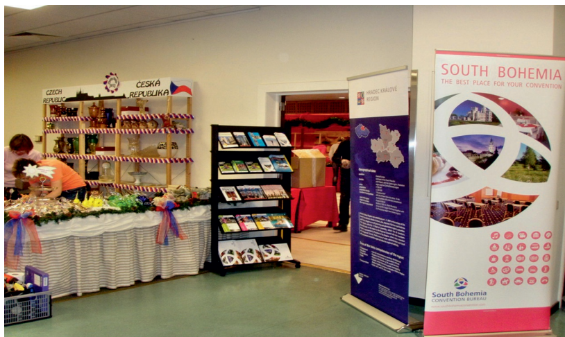
Český stánek na NATO Charity Bazaar

v prostorách velení NATO už od roku 1968. V současné době je ve výboru zastoupeno 35 zemí. Finance na podporu charitativních projektů jsou shromáždovány po celý rok. Část tvoří zisk z prodeje domácích zákusků a koláčů (Bake Sale) z rukou manželek a partnerek vojenského personálu NATO, který se koná několikrát do roka. Dalším zdrojem je výtěžek z akcí pro děti i dospělé (dětské dny, plesy). Největší část financí však pochází z prodeje tradičního zboží a kulinářských produktů zúčastněných států v době konání výročního bazaru. Nezanedbatelným příspěvkem je také výtěžek z prodaných lístků do tomboly, do které přispívá každý stát několika hodnotnými cenami. Letos se šťastní výherci podělili o stovku cen (ČR věnovala křišťálovou vázu a pobyt ve vojenském rekreačním zařízení). Organizátoři NATO Charity Bazaar věnují 35% výtěžku belgickým projektům. Zbylá část, tedy 65%, připadne mezinárodním charitativním organi-