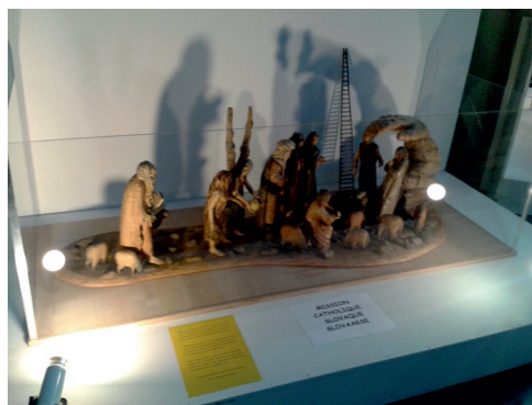
Jihočeský betlém v bruselské katedrále sv. Michala a sv. Guduly