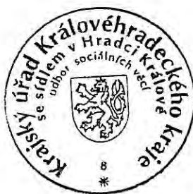
Bc. Tomáš Grulich

Krajský úřad Královéhradeckého kraje, odbor sociálních věcí, Pivovarské náměstí 1245/2, Hradec Králové, 500 03 Hradec Králové 3, který rozhodnutí vydal. O podaném odvolání rozhoduje Ministerstvo práce a sociálních věcí ČR.