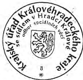
Bc. Tomáš Grulich

Poučení o odvolání: Proti tomuto rozhodnutí se lze dle § 81 správního řádu odvolat do 15 dnů ode dne jeho oznámení, a to podáním učiněným u správního orgánu Krajský úřad Královéhradeckého kraje, Odbor sociálních věcí, Pivovarské náměstí 1245, 500 03 Hradec Králové, který rozhodnutí vydal. O podaném odvolání rozhoduje Ministerstvo práce a sociálních věcí ČR.