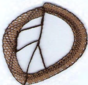
Foto výrobků, které si např. můžete na kurzu vyrobit.