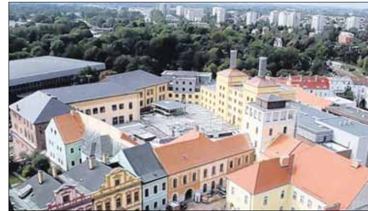
Z ochozu Bílé věže je areál Regiocentra Nový pivovar jako na dlani.

Splátky nemovitosti by měly snižovat příjem z pronájmu komerčních nebytových prostor