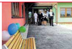
Domovy mají být pěkné