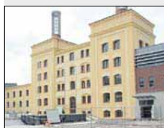
Budova krajského úřadu nezapře průmyslovou minulost.

Od letošního listopadu začne lidem v Hradci Králové sloužit Regiocentrum Nový pivovar. Novou městskou část vznikající v komplexu bývalého králové-