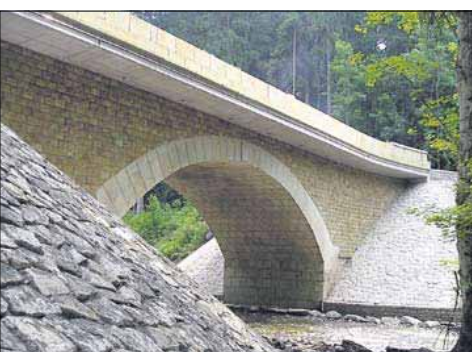
Opravený most přes řeku Zdobnicí u Pěčína.

Mezi další silnice, s nimiž již Evropská unie v poslední době pomohla, patřila vloni například oprava cesty ze Špindlerova Mlýna na polské hranice k obci Przesieka s podporou přes 22