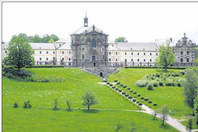
Barokní skvost hospital s kostelem Nejsvětější trojice v Kuksu je cílem mnoha turistů od nás i ze zahraničí. Přijíždějí sem hlavně za sochami Ctnosti a Neřestí pocházejícími z dílny M.B. Brauna.

významnou Obnovu Lázní Bělouves, Revitalizaci areálu Kuks vedoucí k obnově relaxační turistiky v celém areálu památkové rezervace, Valdštejnskou univerzitu Jičín s plánem rozšíření možnosti vysokoškolského studia v regionu nebo řadu projektů na výstavbu čistíček odpadních vod. Unikátní a rozsáhlý projekt se také zaměřil na Integrovaný záchranný systém v Hradci Králové, na podporu prevence rizik, včetně rozvoje a provádění plánů pro prevenci a řešení přírodních a technologických rizik.