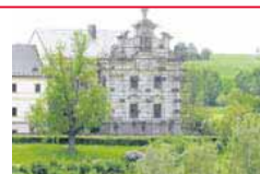
Investice do Kuku se brzy vrátí