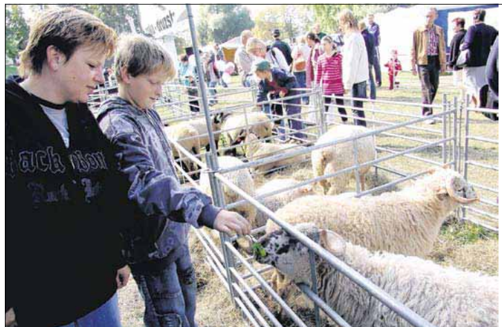
Královéhradecké dožínky propagovaly práci českých chovatelů.