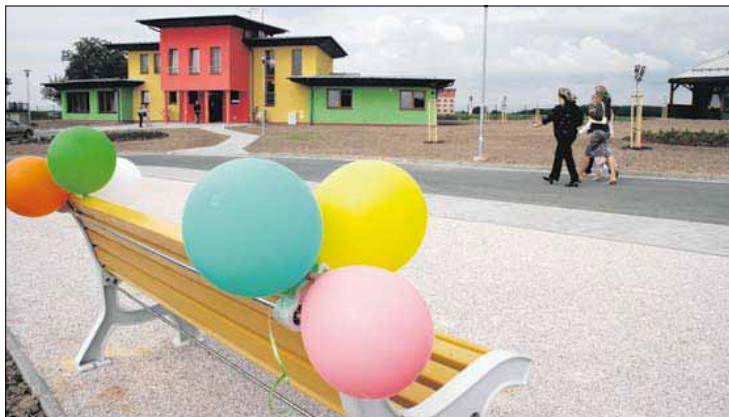
Budovy opočenského Domova Dědina ožívají pestré barevné fasády.

V Chotělicích druhou etapou stavební práce neskončí: další práce počítají s rekonstrukcí podkrovní a střešní, jejíž krytina a krov jsou v havarijním stavu. Půdní vestavbou se zároveň vyřeší problém nedostatečného sociálního zázemí personálu (šatny). Celkový náklad se předpokládá v objemu 10 milionů korun, které zaplatí kraj. „Tuto stavbu chceme zahájit začátkem příštího roku, stav