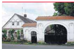
Program podpory památky na venkov