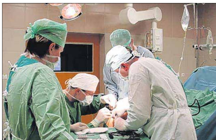
Operativní tým v Oblastní nemocnici Trutnov při práci.

Oblastní nemocnici Trutnov potrápil především havarijní stav