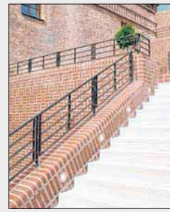
Schodiště spojující Komenského ulici s pivovarským nádvořím