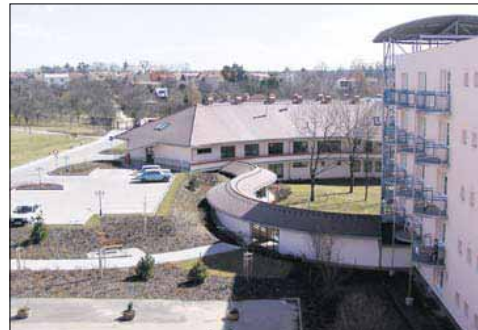
Domov důchodců v Hradci Králové má od poloviny letošního roku pro klienty o osmáct nových lůžek navíc.

V odvětví sociálních věcí v kraji se rozvíjí přípravy (varianty řešení, studie, odhady potřebných zdrojů) řady menších akcí. Ty mají odstranit nejrůznější provozní či technické problémy, upravit prostředky na budoucí údržbu zastaralých objektů a technologických zařízení a především zlepšit podmínky péče o klienty. Těmi jsou rekonstrukce a rozšíření stísněných prostor (v Domově důchodců Pilníkov), zateplení, výměny oken, dokončení je instalace tepelného čerpadla v Domově důchodců Lampertice, připravuje se obdobná akce v Ústavu sociální péče Hajnice.