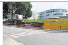
V nemocnici Náchod dostali energocentrum