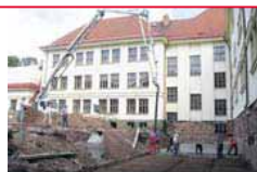
Do oprav školních jídeln plynou nemalé peníze