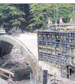
Vozovka, která přes most vede, se rozšířila o půldruhého metru