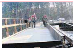
Rekonstrukce silnic se týkají i mostů