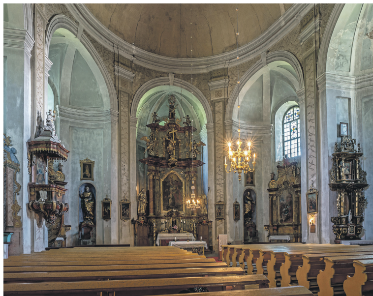
Interiér kostelu sv. Barbory v Otovicích u Broumova.

Jednotlivé stavby otce a syna Dientzenhoferových z tohoto souboru vznikly v poměrně krátkém období mezi lety 1709–1743, a to na zakázku tehdejšího opata