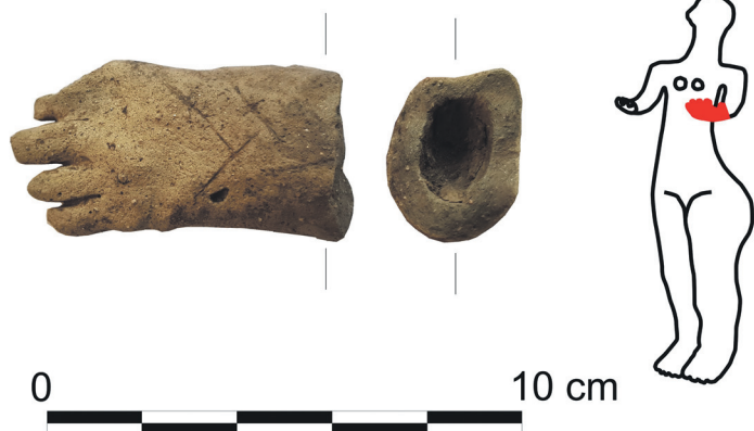
Nalezená část neolitické plastiky, vpravo vyznačena možná původní celková podoba v případě, že by se jednalo o část ze sošky, které jsou někdy nazývané jako neolitické venuše.

Ve dnech 11. března až 17. dubna se v Regionální muzeum a galerii v Jičíně uskuteční výstava, kde si zájemci budou moci prohlédnout artefakty ze záchranných výzkumů v roce 2021, tedy i s těmi, které byly objeveny pod jičínskou nemocnicí. |